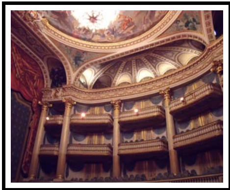
Le Grand Théâtre de BORDEAUX GIRONDE