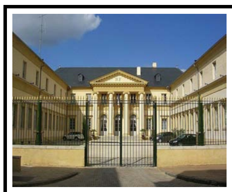
Préfecture de MONT DE MARSAN LANDES