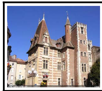
Mairie d'AGEN LOT ET GARONNE