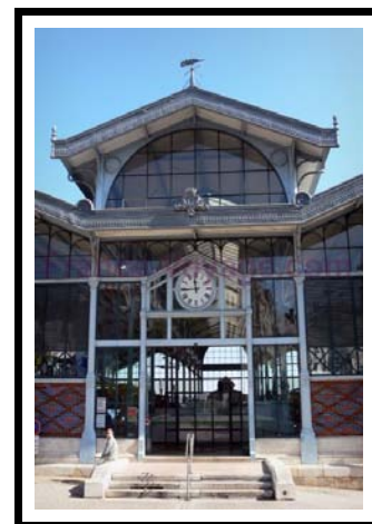
La Halle d'ANGOULÈME CHARENTE