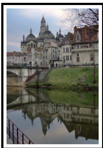
Saint Front PÉRIGUEUX DORDOGNE