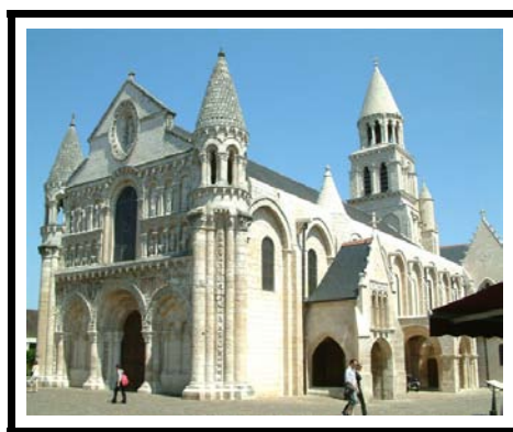
Notre Dame à POITIERS VIENNE