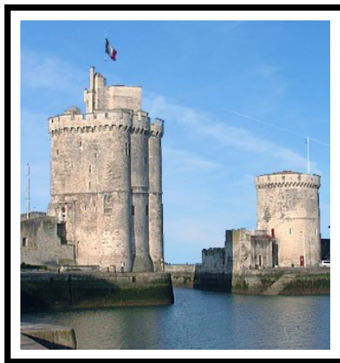
Les Tours de LA ROCHELLE CHARENTE-MARITIME